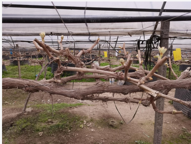
促早栽培葡萄园，葡萄处于萌芽期