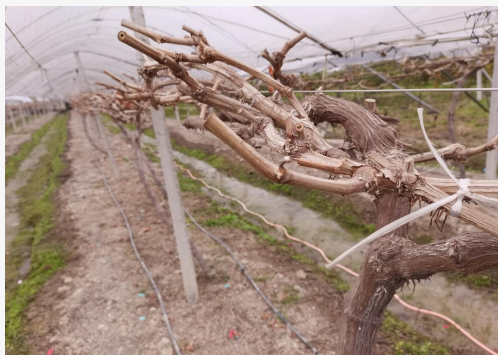
葡萄仍处于休眠期